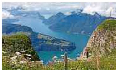
Auf Entdeckungstour in Schwyz. Seite 24