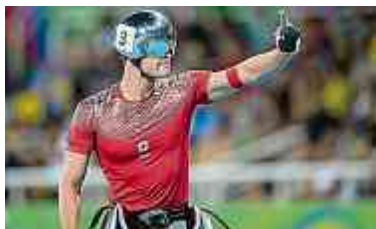
Marcel Hug holt in Rio zweimal Gold. Seite 6